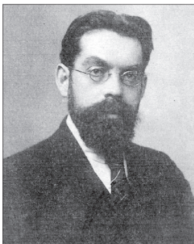
Рис. 1. Фото І. Красковського

Ключові слова: білоруський футбол, Іван Красковський, Вільнюс.